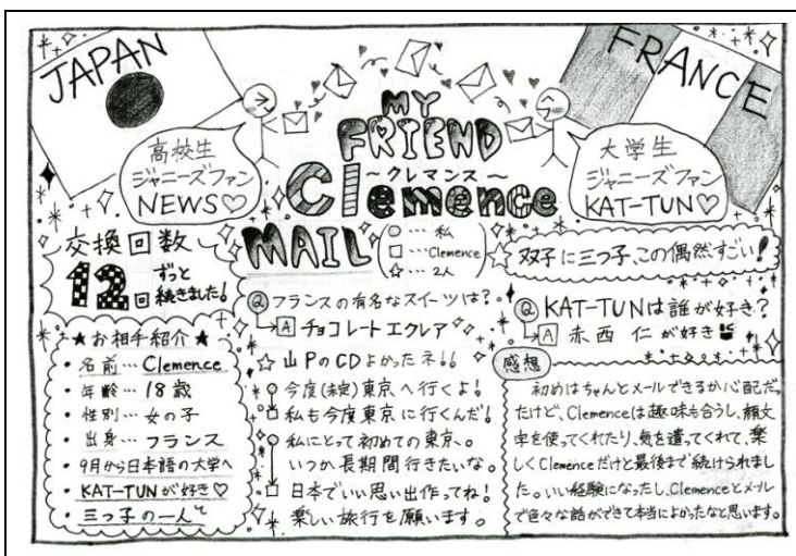
メールフレンドとのやり取りをまとめた冊子 (内容)